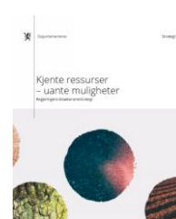
Statsrådene Monica Mæland, Jon Georg Dale, Per Sandberg, Tord Lien, Torbjørn Røe Isaksen, Vidar Helgesen, Ketil Solvik-Olsen, Børge Brende, Jan Tore Sanner og Elisabeth Vik Aspaker 29. november 2016